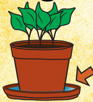
الصحون أسفل أصائص النباتات