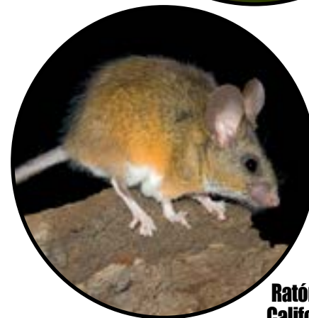
Ratón de California