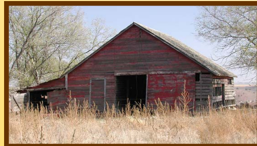
Granjeros y edificios externos pueden alojar roedores