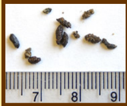
Excremento de ratones

infección ocurre cuando una persona respira polvo contaminado con excremento o cuando se pone en contacto con roedores infectados. El virus no se transmite entre personas.