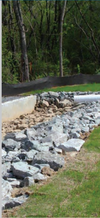
Distribuidor de flujo