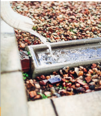
Downspout at splash block