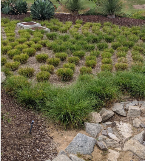
Pananim na BMP

Ang mga Pinakamagandang Kaugalian sa Pamamahala (BMP) na Pang-istruktura ng Stormwater ay inilalagay sa ilang propyedad sa buong Lalawigan upang makatulong na maiwasan ang mga pollutant tulad ng basura, pataba, pestisidyo, at sediment na makarating sa mga storm drain at sa huli, sa ating mga lokal na sapa, ilog, at karagatan. Ang inyong development na pangresidensyal ay isa sa daan-daan sa buong Lalawigan na may hindi bababa sa isang BMP.