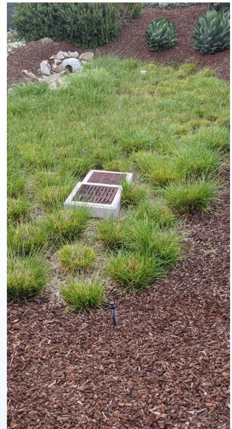
Pananim na BMP

Ang mga uri ng BMP na minementena ng HOA ay maaaring malaki tulad ng mga detention basin o maliit tulad ng karaniwang insert filter ng storm drain.