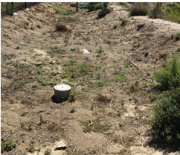
Vegetación en mal estado