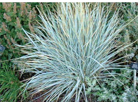
Canyon Prince Wild Rye