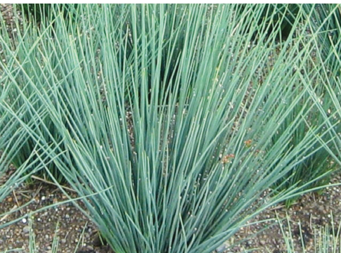
California Gray Rush