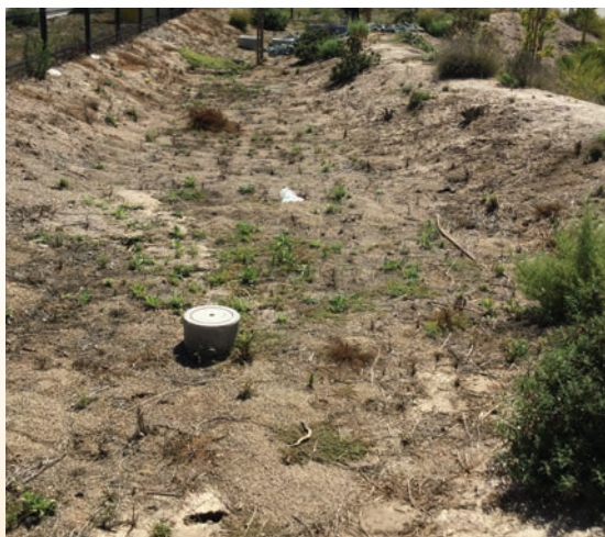
Mga pananim na hindi malusog