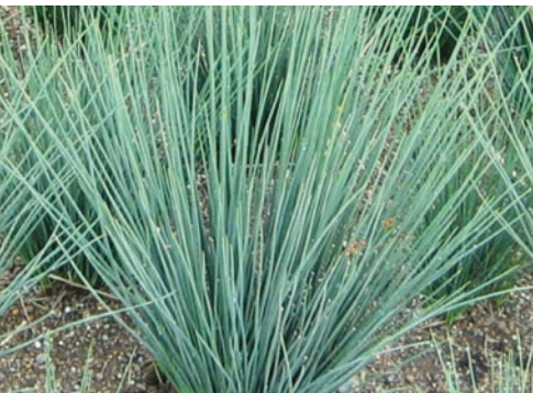
California Gray Rush