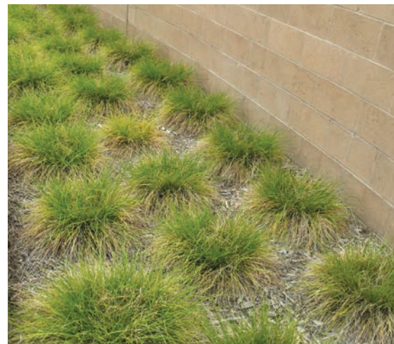
Mga halaman na California-friendly