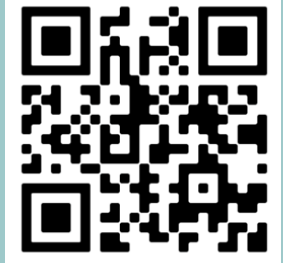
MCRT에 대한 추가 정보를 얻으려면 스캔하세요