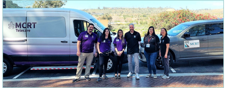
카운티의 이동 위기대응 팀 제공자

카운티 전역의 모든 연령을 대상으로 제공되며, MCRT는 지역사회 내에서 대응하여 알코올, 마약 또는 정신건강 관련 위기를 경감하는 훈련을 받은 행동건강 전문가로 구성된 팀으로, 법률 집행 대응의 대안입니다.