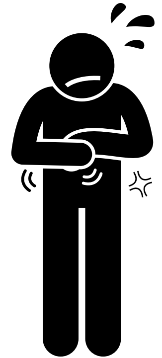
Dolor de estómago