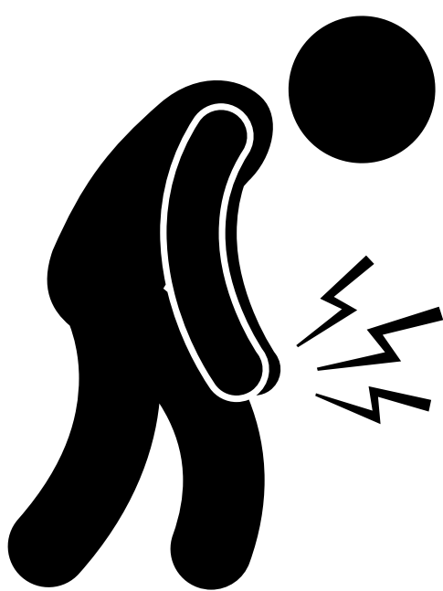
Dolor de articulaciones