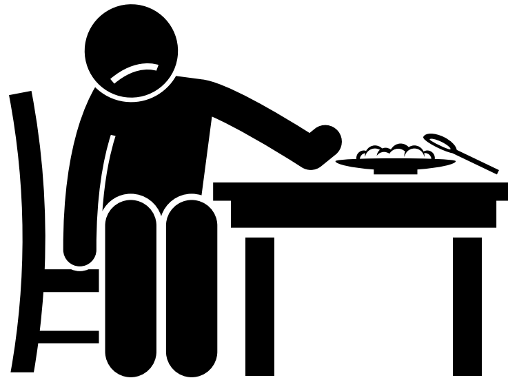
Pérdida del apetito