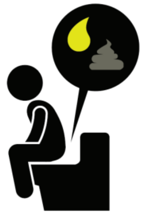
Orina oscura, heces pálidas, diarrea