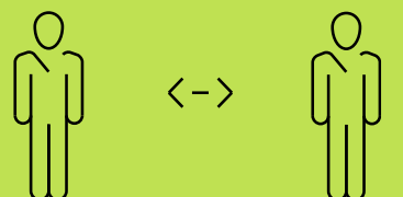
ማሕበራዊ ወይ ኣካላዊ ርሕቀት ኣተግብር