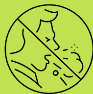
ክትሰዕል ወይ ክትህንጥስ ኣፍካ ሸፍን