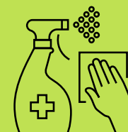
ከብሕታት ኣጽርይ ካብ ታሃዋስያን ነጻ ግበር