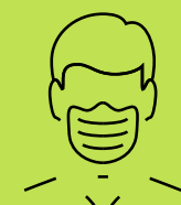
ገጽ መሸፈኒ ውደይ