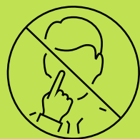
ገጽካ ካብ ምሓዝ ተቐጠብ