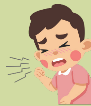
Dificultad para respirar