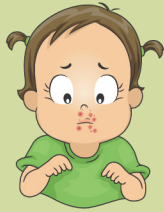
Erupción alrededor de la boca