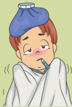
Fiebre y escalofríos