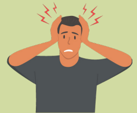
Dolor de cabeza intenso