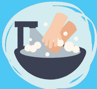
Lávate las manos con frecuencia.