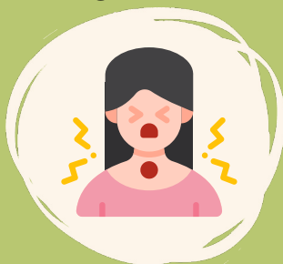
Garganta muy roja y dolorida