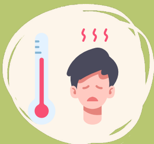
Fiebre o escalofríos