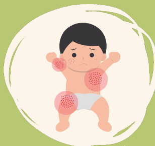
Piel de color rojo brillante