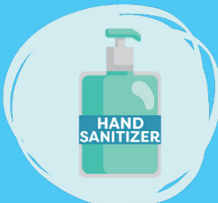
Utilice desinfectante de manos si no dispone de agua y jabón.