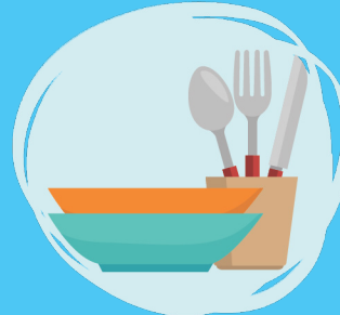
Lave los utensilios utilizados por una persona enferma.