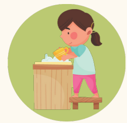
Lave los vasos, utensilios y platos después de cada uso.