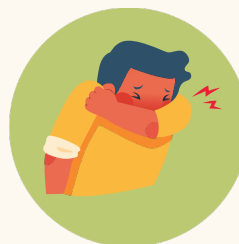
Cubrirse la nariz y la boca cuando tosa o estornude.