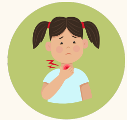
Dolor de garganta