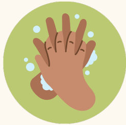
Lavarse las manos con agua y jabón.