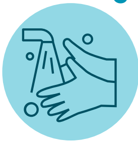
Lava tus manos seguido