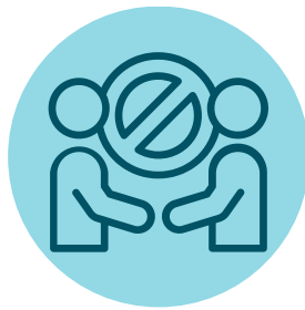
Evita el contacto con personas enfermas