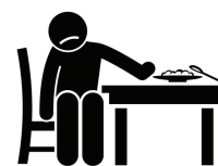
Pérdida de Apetito