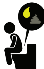
Orina oscura, heces pálidas, y diarrea

Si usted sospecha que pudiera estar padeciendo de Hepatitis A por presentar los síntomas anteriores, acuda a su médico o a la sala de urgencias más cercana. Siempre lávese las manos con agua y jabón después de ir al baño y antes de entrar en contacto con alimentos.