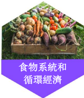
食物系統和 循環經濟