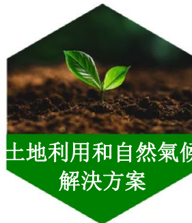
土地利用和自然氣候 解決方案