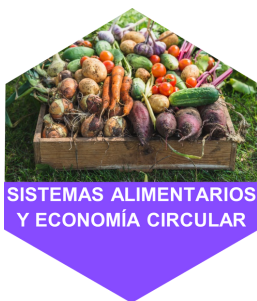
SISTEMAS ALIMENTARIOS Y ECONOMÍA CIRCULAR