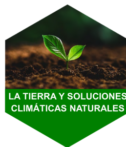
LA TIERRA Y SOLUCIONES CLIMÁTICAS NATURALES